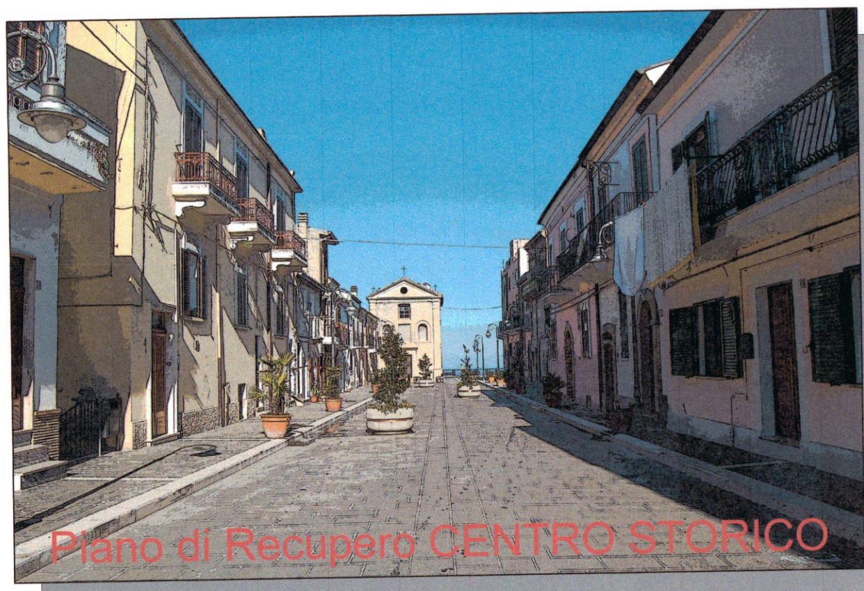
Piano di Recupero CENTRO STORICO

COMUNE DI SAN VITO CHIETINO (Provincia di Chieti)